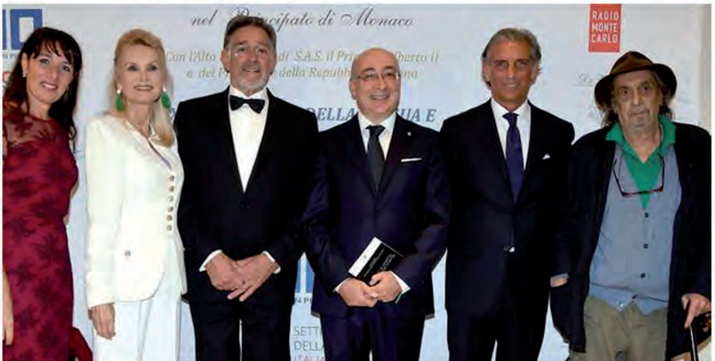
GLI ATTORI PREMIATI